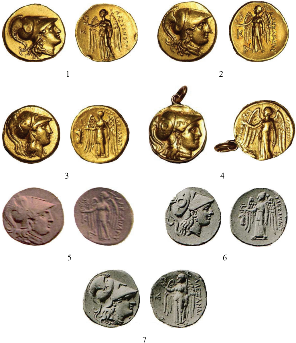
Planșa I. 1-4. Staterii de tip Alexandru cel Mare din colecția Mariei Golescu: 1. Kallatis (Price 897); 2. Kallatis (Price 914); 3. Sardes (Price 2533); 4. Babylon (Price 3748); 5. Stater tip Alexandru cel Mare din Kallatis (Price 914), licitația Hess, 15 octombrie 1903 (nr. 96); 6. Stater tip Alexandru cel Mare din Sardes (Price 2533), licitația Schlessinger, 4 februarie 1935 (nr. 656); 7. Stater tip Alexandru cel Mare din Kallatis (Price 897), licitația Schlessinger, 4 februarie 1935 (nr. 671).