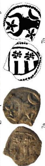
Planșa I. Jumătăți de groși ale lui Petru I repartizate conform criteriilor tipologice (nr. 1-6) și un groș ajustat la margine până la dimensiunea unei jumătăți de groș (nr. 7).

Un groș ajustat la margine până la dimensiunea unei jumătăți de groș