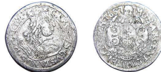
10 (inv. 3827)