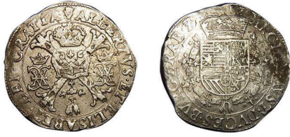
1 (inv. 3843)