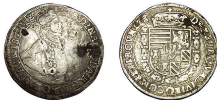
5 (inv. 3851)