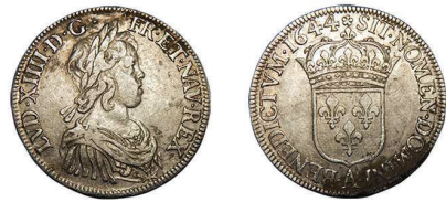
2 (inv. 3860)