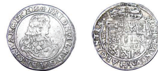
11 (inv. 3822)