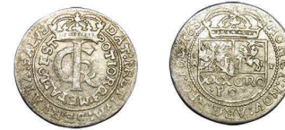
7 (inv. 3780)