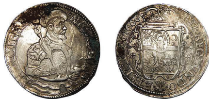
4 (inv. 3861)