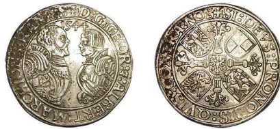
3 (inv. 3845)