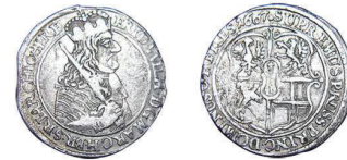
9 (inv. 3820)