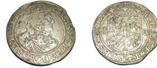
6 (inv. 3453)