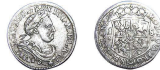
8 (inv. 3813)