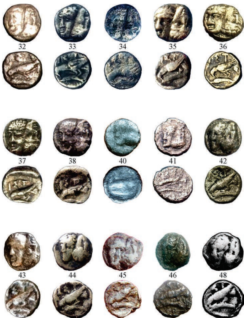
Planșa III. Monede de argint emise la Istros (Grupa I)