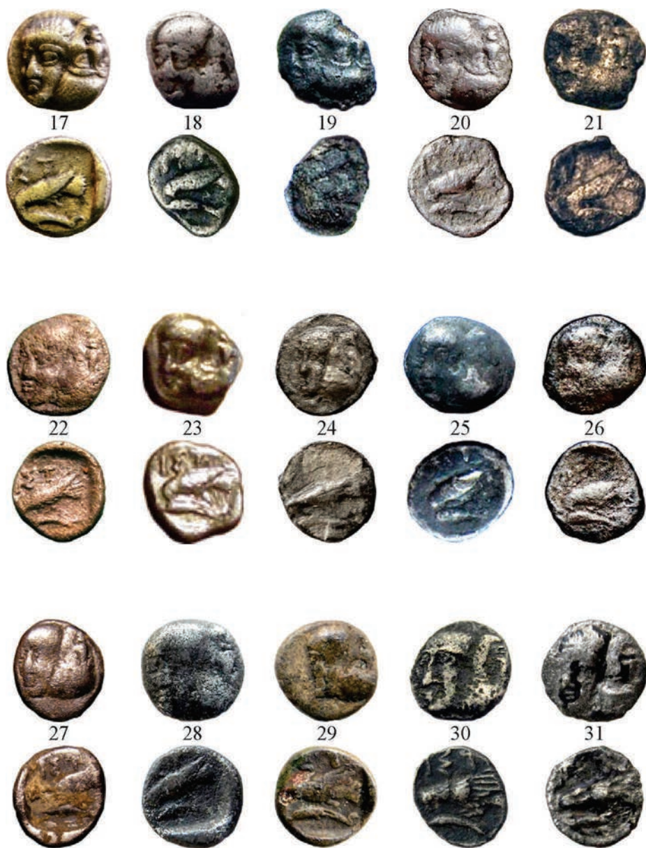
Planşa II. Monede de argint emise la Istros (Grupa I)