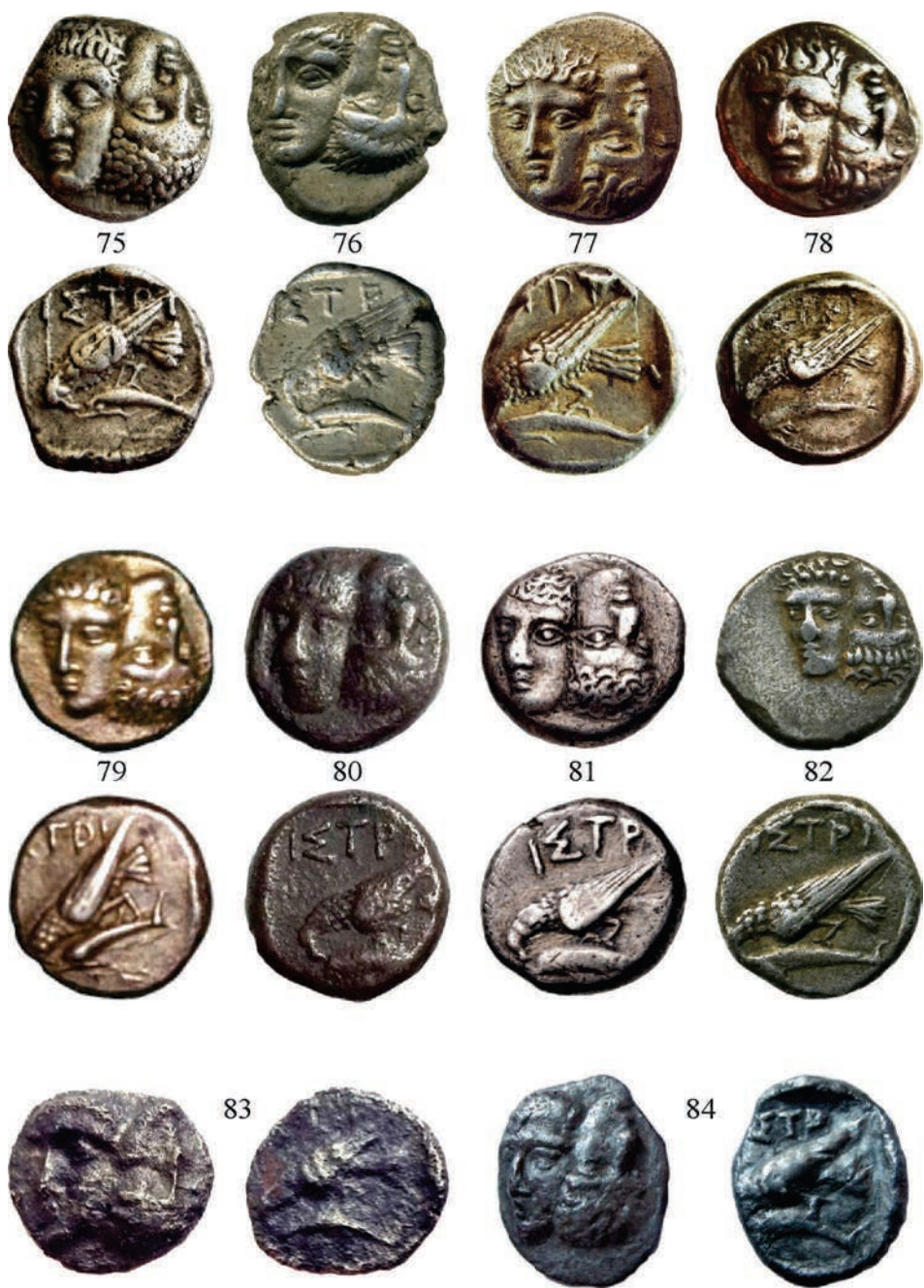
Planșa VI. Monede de argint emise la Istros (Grupa II)