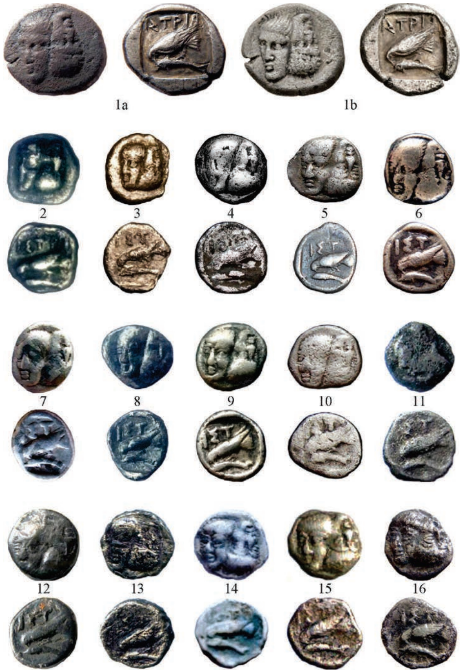
Planșa I. Monede de argint emise la Istros (Grupa I)