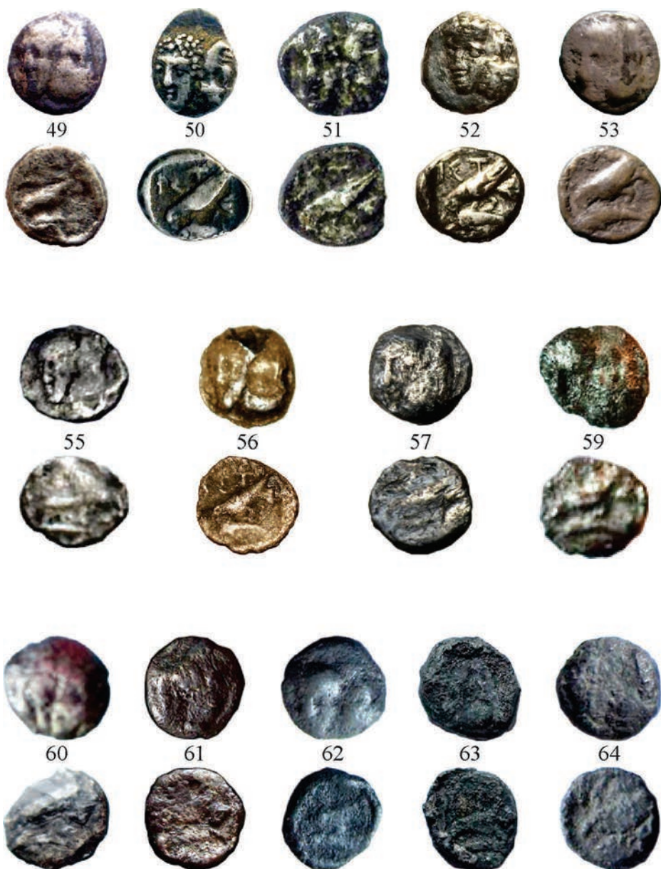
Planșa IV. Monede de argint emise la Istros (Grupa I)