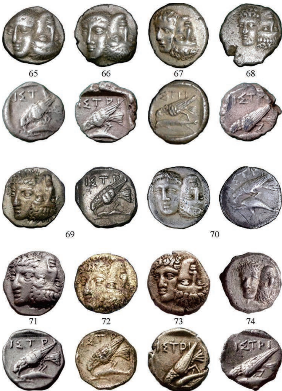
Planşa V. Monede de argint emise la Istros (Grupa II)