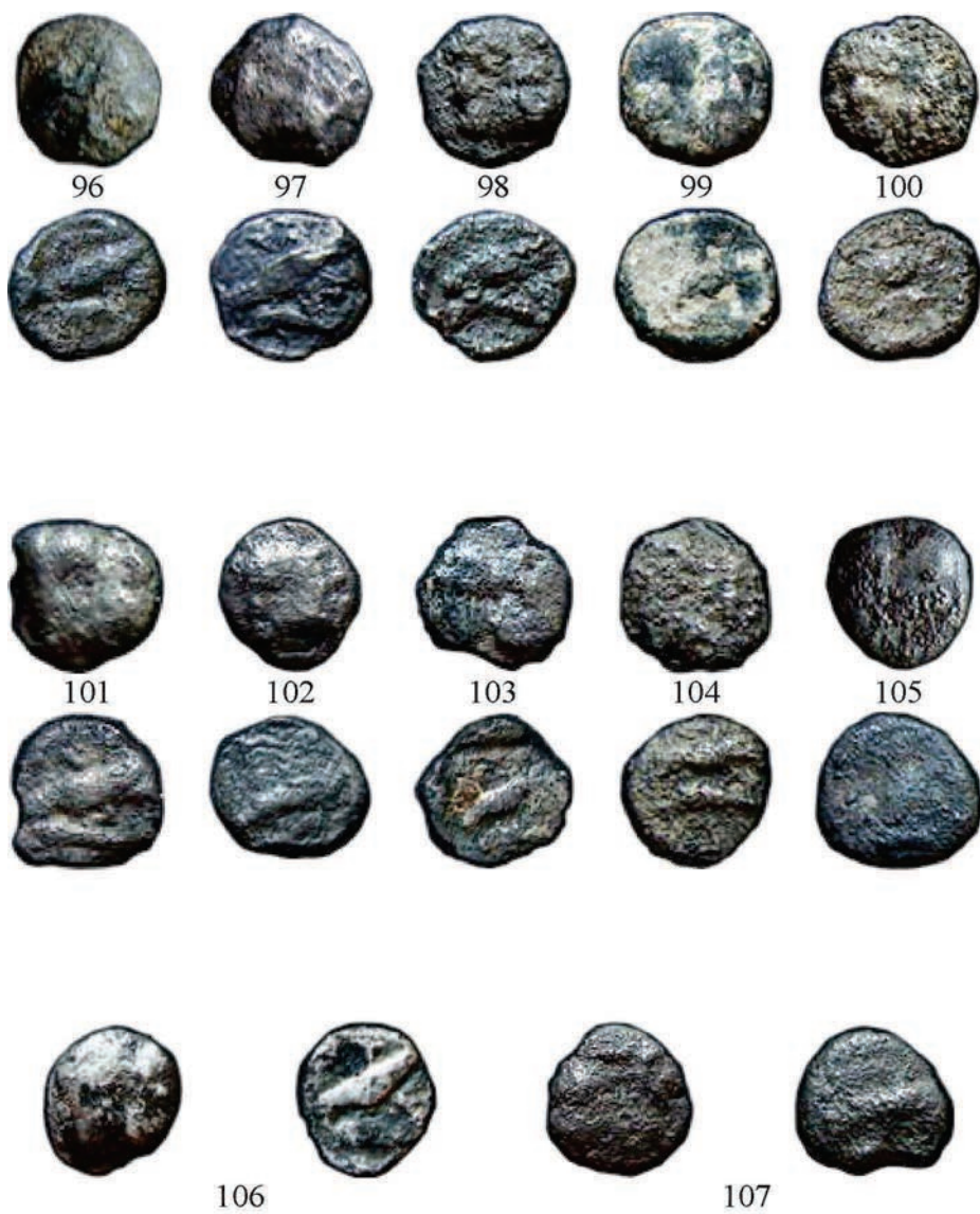
Planșa VIII. Monede de argint emise la Istros (Grupele I-II)