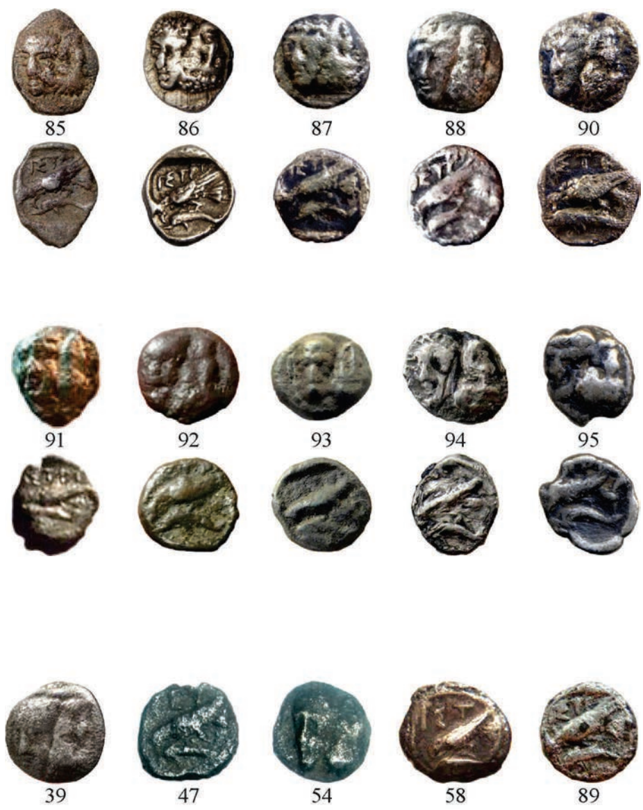
Planșa VII. Monede de argint emise la Istros (Grupele I-II)