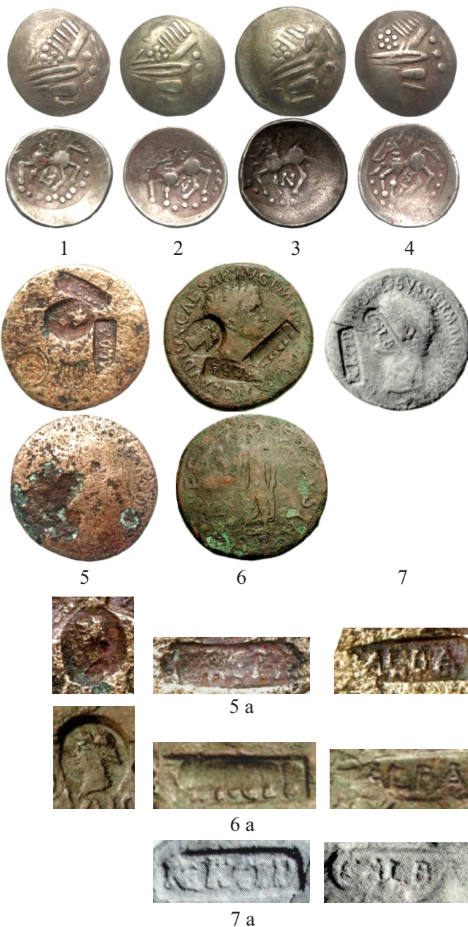
Planșa I. Tezaurul de monede geto-dacice de tip Inotești-Răcoasa de la Cochirleni, com. Rasova, jud. Constanța din 1940 (1-4); sesterți romani contramarcăți (5-7). Contramărcile sunt mărite de 1,5 – 2 ori.