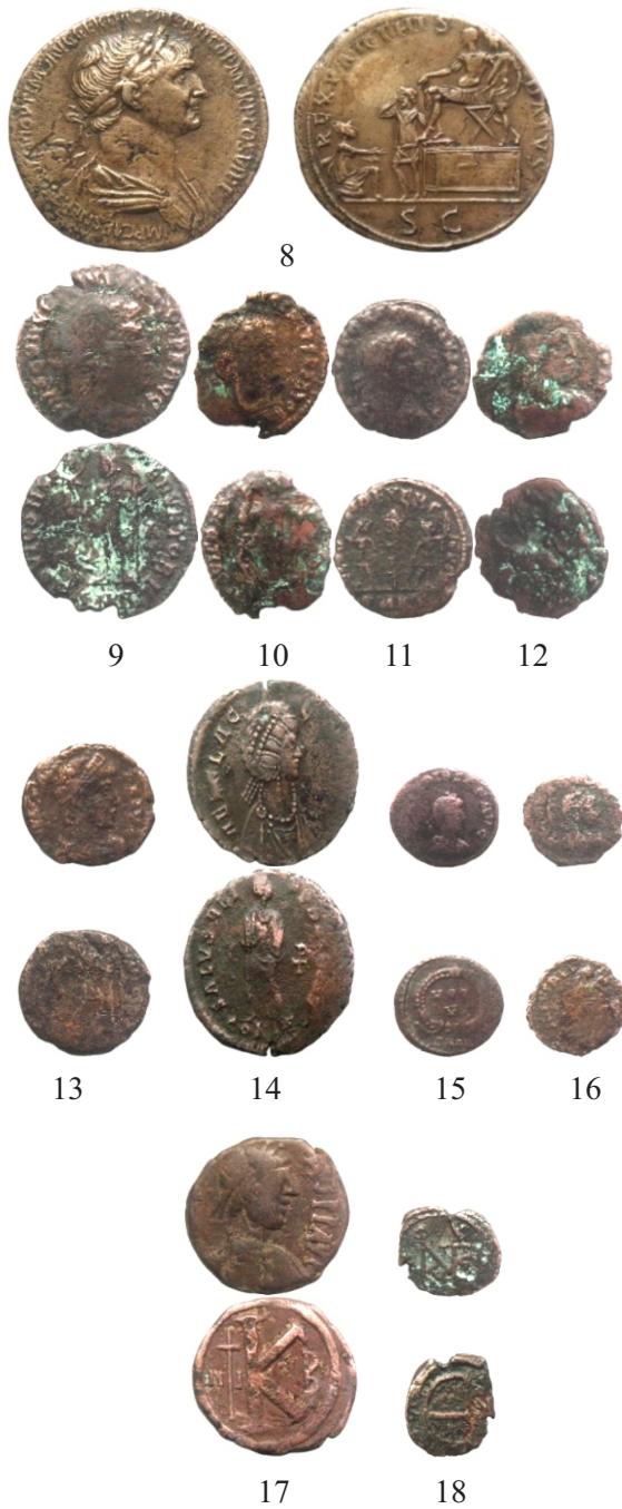
Planșa II. Monede de bronz descoperite la Cochirleni, com. Rasova, jud. Constanța.